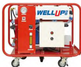
【雨水ろ過装置：WELL UP ミニ】

雨水ろ過による災害時の飲料水の提供、防災用のマンホールトイレ及びかまどスツールの設置、顔認証システムの採用等により、防災性・防犯性に優れた配慮がなされている点