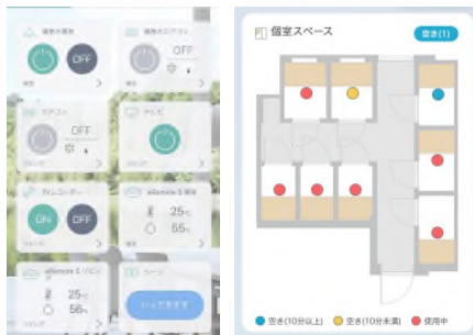
【入居者アプリ(左：専有部 IoT、右：空席確認)】

IoT による設備機器等の遠隔制御の導入、ワークスペースや屋上テラスの設置、レンタルサイクルの実施、ワークスペースにおけるサーカディアン照明の採用等により、入居者の利便性・快適性を高めている点