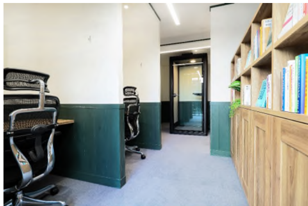
【共用ワークスペース】