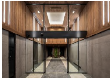
【吹抜けエントランスホール】

エントランスホールの吹抜けやワークスペースの大規模窓面による採光利用、節水型の水栓及び便器の採用、雨水の灌水利用等により、省エネ・省資源に配慮している点