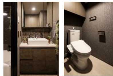
【節水型の水栓及び便器】