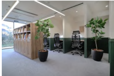
【ワークスペースの大規模窓面】