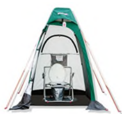
【マンホールトイレ】