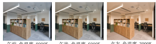
【サーカディアン照明】