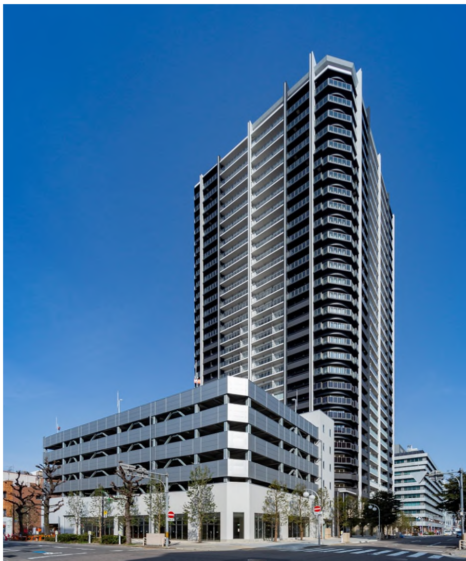
■プライドタワー名古屋錦（南東側より区域全体を望む）

野村不動産株式会社(本社：東京都新宿区/代表取締役社長：松尾 大作)、旭化成不動産レジデンス株式会社(本社：東京都千代田区/代表取締役社長：兒玉 芳樹)、NTT都市開発株式会社(本社：東京都千代田区/代表取締役社長：辻上 広志)、株式会社長谷工不動産(本社：東京都港区/代表取締役社長：天野 里司)、株式会社長谷工コーポレーション(本社：東京都港区/代表取締役社長：池上一夫)は、名駅エリアと栄エリアの中間に位置する伏見・錦二丁目エリアで地権者の皆様や地域の方々と推進しております『プライドタワー名古屋錦』が竣工したことを、お知らせいたします。