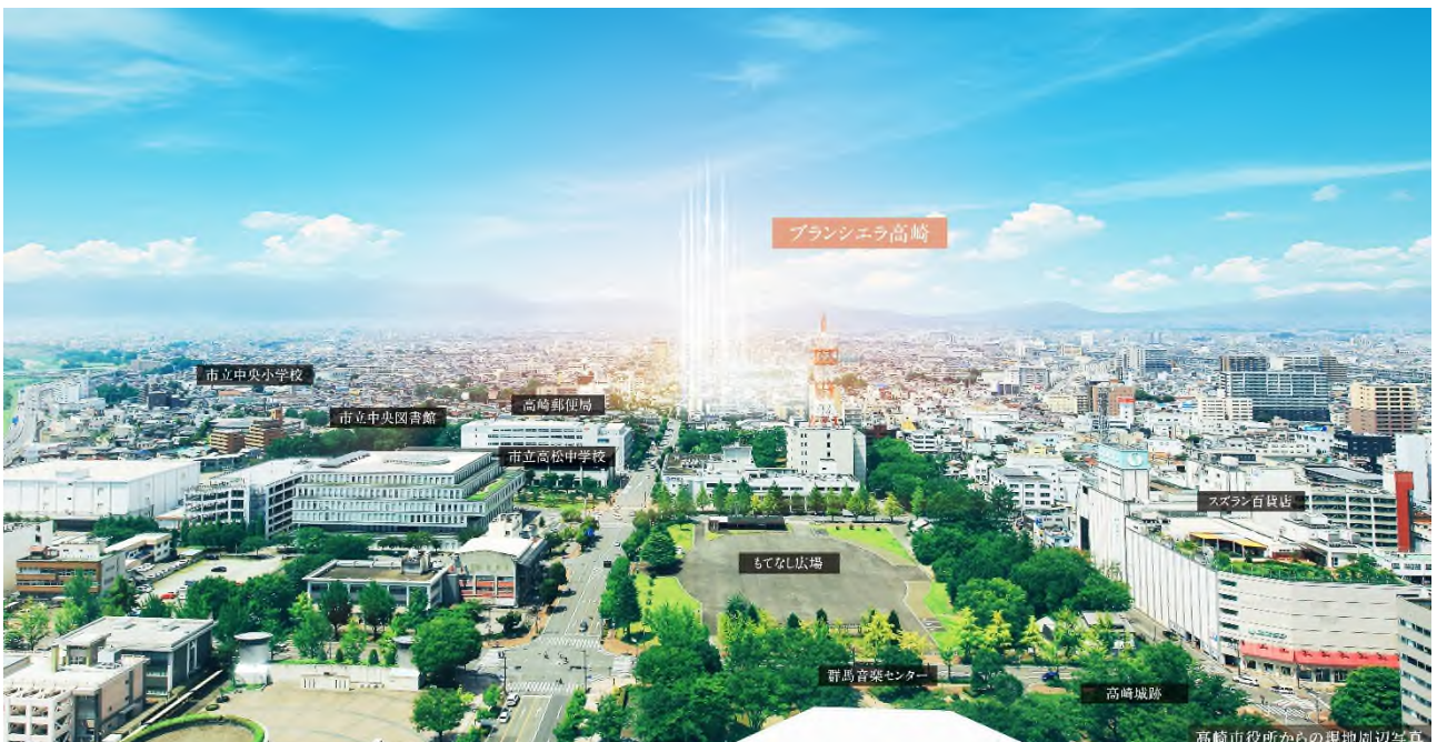
高崎市役所からの現地周辺写真（2021年7月撮影）

本物件は、「都市景観大賞」に輝いた高崎城址地区を目の前にする恵まれた立地が魅力です。高崎市役所や中央図書館をはじめ数々の公共施設が揃う利便性と、烏川や姉妹都市公園、城址公園など緑にも恵まれた静穏な住環境が広がっています。中でも城址公園には約 300 本のソメイヨシノやシダレザクラが植えられ桜の名所としても人気があります。また、県内でも屈指の進学校として知られる高松中学校の学区内に位置し、徒歩 10 分圏内には複数の幼稚園・保育園があり教育環境も充実しています。