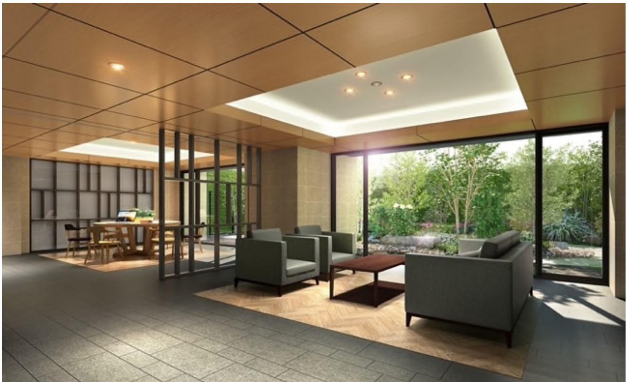
ラウンジ完成予想 CG