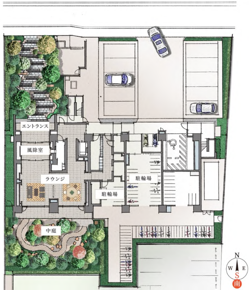
敷地配置図イメージイラスト

共用部にはゆったり寛げるソファラウンジ、テレワークにも適したデスクラウンジを設けました。Wi-Fi が利用可能で、電子書籍の読み放題サービスも導入するなど、第二のリビング空間のように過ごせる2つのラウンジを備えています。植栽が豊かな中庭にはラウンジから自由に入出りが可能となっており、息抜きに四季折々の変化を感じて憩いくつろげる空間を提供いたします。