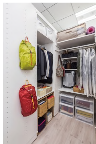
(参考) ウォークインクローゼット