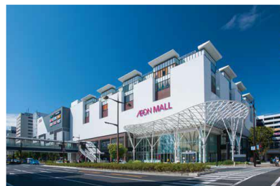
【イオンモール岡山】