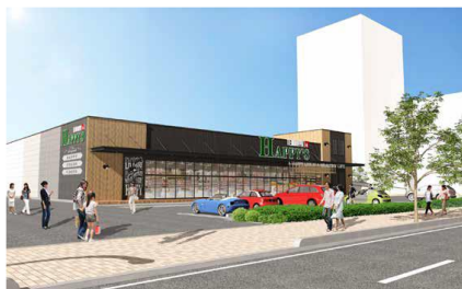
【天満屋ハピーズ昭和町店】

周辺施設には、「イオンモール岡山」(徒歩5分)や「奉還町商店街」(徒歩10分)などがあり、生活利便性が高い立地にあります。また、「厳井東公園」(隣接)や「岡山市立石井幼稚園」(徒歩6分)や「岡山市立石井小学校」(徒歩7分)、「済生会病院」(徒歩17分)など医療・教育施設、公園なども充実しています。